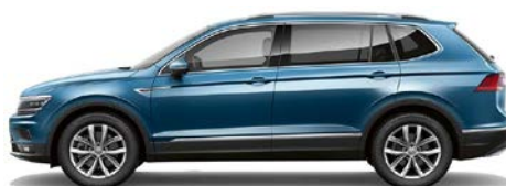
B2 B2 - Albastru (blue silk)