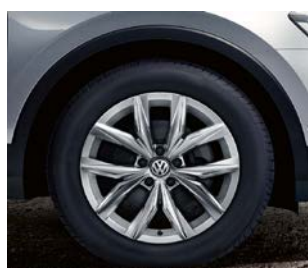
Jante aliaj „Kingston” 7 J x 18 anvelope 235/55 R18 Dotare opțională, cod PJM