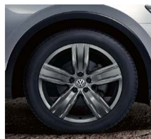
Jante aliaj „Victoria Falls” 7J x 19 anvelope 235/50 R19 Dotare opțională, cod PJF