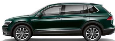
X1 X1 - Verde (dark moss green)