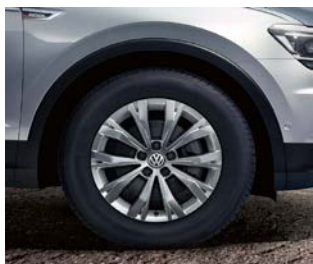
Jante aliaj „Montana” 7 J x 17 anvelope 215/ 65 R17 Dotare standard Trendline