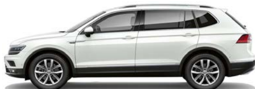
0Q 0Q - Alb (pure white)*