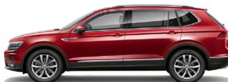
7H 7H - Rosu (ruby red)