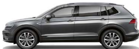
2R 2R - Gri (platinum grey)