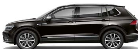
2T 2T - Negru (deep black)

* Prețurile pentru aceste culori se află la opționale