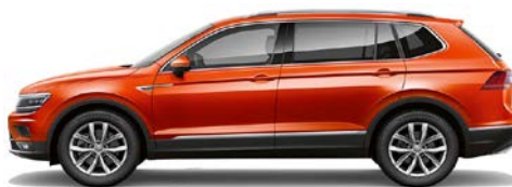
V9 V9 - Orange (habanero orange)