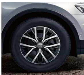
Jante aliaj „Tulsa” 7J x 17” anvelope 215/65 R17 Dotare opțională, cod PJV