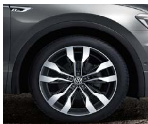
Jante aliaj „Suzuka” 8,5J x 20 anvelope 255/40 R20 Dotare opțională Highline, cod PJS (doar împreună cu pachet R-Line)