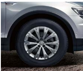
Jante aliaj „Montana” 7 J x 17 anvelope 215/ 65 R17 Dotare standard Trendline