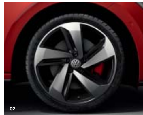
01 18-Zoll-Leichtmetallrad „Brescia“, Volkswagen R SO 02 17-Zoll-Leichtmetallrad „Milton Keynes“ S